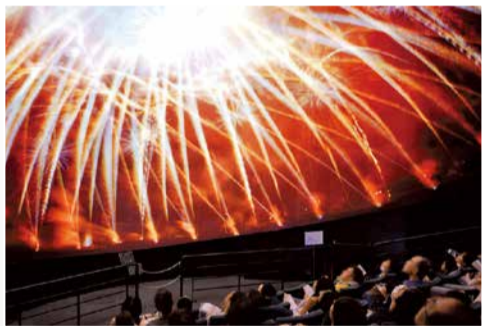
「ハナビリウム」[参考図版]

第12回となる今回の総合テーマは、「時間を想像する」。国内外の78組95人の作家が、身近であると同時に謎に包まれている「時間」を題材にした作