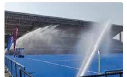
試合前には散水を行いボールの抵抗を減らす

所在地 品川区八潮4丁目(メインピッチ)、大田区東海1丁目(サブピッチ)。東京モノレール「大井競馬場前」駅下車、徒歩約8分。