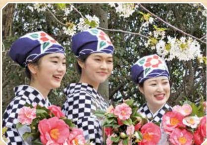
伝統衣装を着たあんこさんが祭りを盛り上げる

竹芝ふ頭から高速船で2時間足らずで行ける大島では、椿が見頃を迎えるこの時期、島をあげての一大イベント「椿まつり」を開催。3月22日(日)までの期間中は、名物料理や特産品屋台の出店、「あんこさん」の衣装の貸し出しなど、島内各所でさまざまなイベントが行われる。