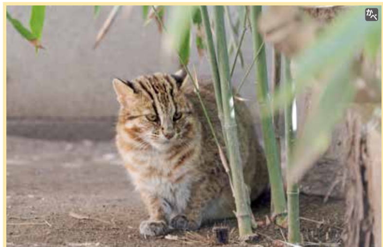
ツシヤママネコの「もも」、13歳