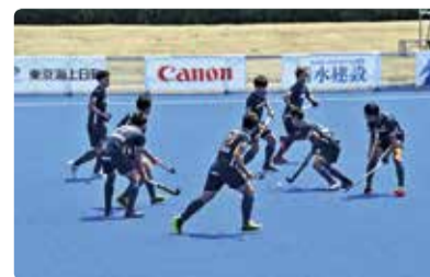
スティックを使いボールを相手ゴールへ

「大会をきっかけにホッケーがより多くの人に親しまれるようになることを期待しています。また、サッカー、ラクロスのほか、グラウンドゴルフなど多目的に利用できる施設となりますので、幅広い年代の方に活用してほしいと考えています(施設管理担当者)」