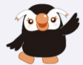
北方領土イメージキャラクター エリカちゃん