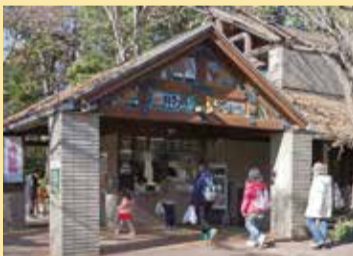
正門は、動物のステンドグラスが目印

動物たちが置かれた状況を知ると、今までとは違った目で、彼らが見えてくるかもしれない。