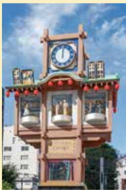
江戸落語のからくり時計

横丁を抜けて浜町公園で一休み。肥後藩細川氏の庭園跡に作られた広い園内ではベンチでくつろぐ人も多く、地域の憩いの場となっている。隅田川に面しておりスカイツリーを眺めながらの水辺散策もおすすめだ。