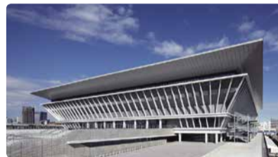
斜めの柱が特徴的な外観

「東京2020大会の延期を受け、大会準備と並行して、都民の皆さん向けの施設見学会や体験会などを設け、多くの方にご利用いただきました。今後も、皆さんに親しまれる施設となるように引き続き取り組んでいきます。(施設管理担当者)」