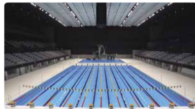
手前にメインプール、奥にダイビングプールを配置