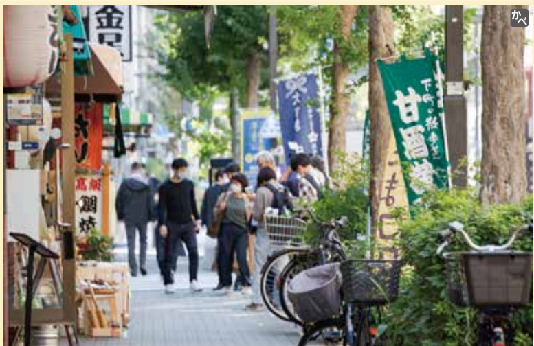
人が行き交う甘酒横丁