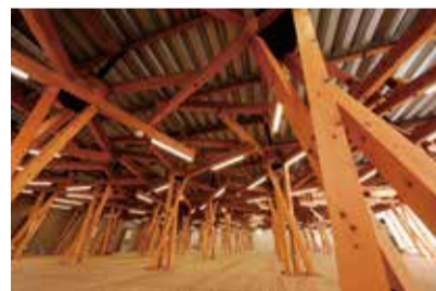
ビレッジプラザ(内装整備前/2年8月時点)

居住棟は、民間事業者から借り受けた建物を活用しています。オリンピック開催時に1万8,000ベッド、パラリンピック開催時には8,000ベッドを確保する計画で、大会後は大会用内装の撤去や改修工事が行われ、分譲住宅や賃貸住宅等になる予定です。メインダイニングホールでは、宗教や食習慣など多様性に配慮した食事を24時間体制で提供します。この他、日本食や地域特産物を活用した食事を提供するカジュアルダイニングやフィットネスセンターなどもあります。