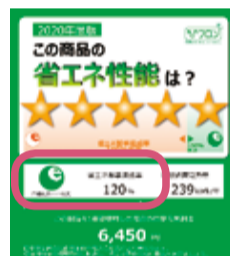
旧ラベル(3年10月まで)