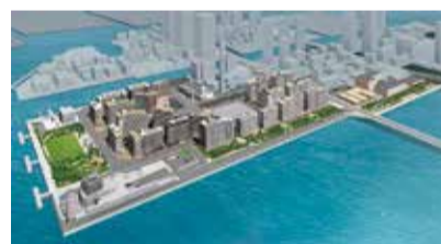
選手村完成イメージ図(元年8月時点)

大会期間中に選手などが滞在する選手村は、オリンピック・パラリンピックの各競技会場とのアクセスが良い中央区晴海地区に整備されます。三方を海に囲まれた敷地の広さは約44ha。居住棟やメインダイニングホールなどがある「居住ゾーン」、雑貨店やカフェ等の店舗などが入る「ビレッジプラザ」、選手村の運営機能を集めた「運営ゾーン」の3つのエリアで構成されています。選手のプライバシーと安全を確保するため、関係者以外は立ち入ることができません。