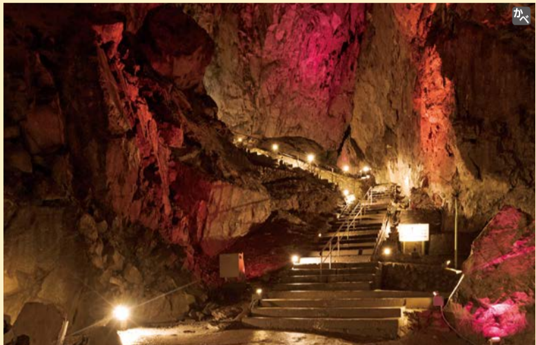
巨大な空間が広がる「死出の山」付近