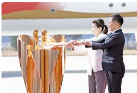
聖火到着式(2年3月20日)

東日本大震災から10年の節目に行われる聖火リレーとして、復興の歩みを進める被災地をはじめ全国各地を回り、日本全国の人々に希望と勇気を届けていきます。