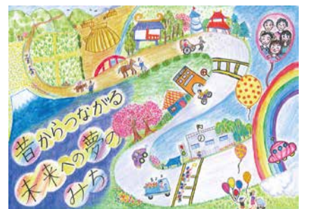
最優秀賞受賞作品

テーマ/「人・街・未来」つながる「みち」づくり。対象/都内在住・在学の小・中学生。規格/「みち」に関する標語を必ず入れること。四つ切り画用紙。1人1作品まで。応募/6月4日(消印)までに郵送で、所定の応募票(HPで入手)を作品裏面に貼り、「夢のみち2021」事務局(〒223-0053横浜市港北区綱島西2-7-6-3階)☎045-633-1960へ。 罇東京都道路整備保全公社☎03-5381-3368