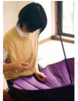
傘づくりの様子 (株式会社小宮商店)

東京都では、全ての女性が意欲と能力に応じて多様な生き方が選択できる社会の実現に向け、女性の活躍推進に取り組む企業や団体・個人を表彰しています。