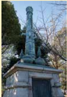
砲身と砲弾を模した高島秋帆紀功碑

新鮮な喜びに会える「板橋十景」は、街のかけがえのない財産として、多くの人に愛されている。