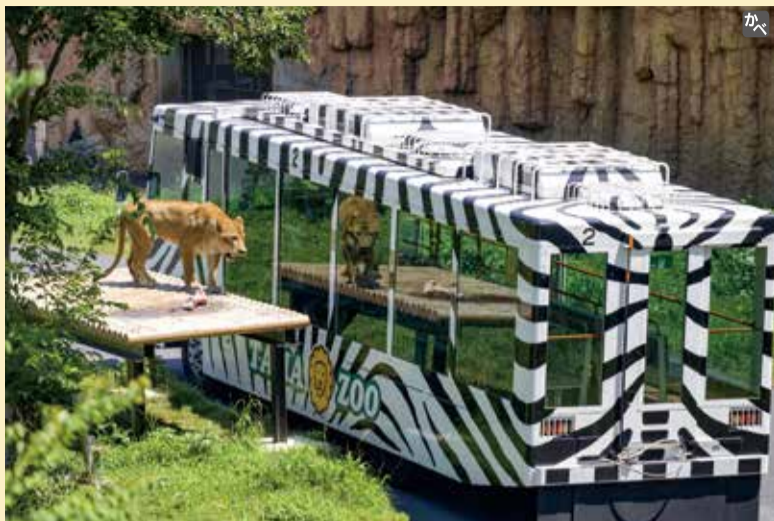
広い敷地で暮らすライオンを車内から観覧できる「ライオンバス」