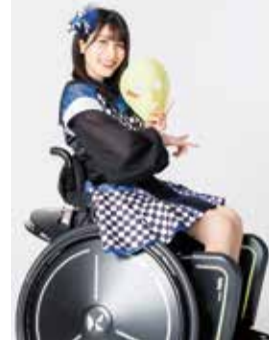
仮面女子メンバー

車いすラグビー準決勝で、イギリスに敗れた時の日本選手の涙が忘れられません。テレビの前で応援していた私も一緒に涙しました。