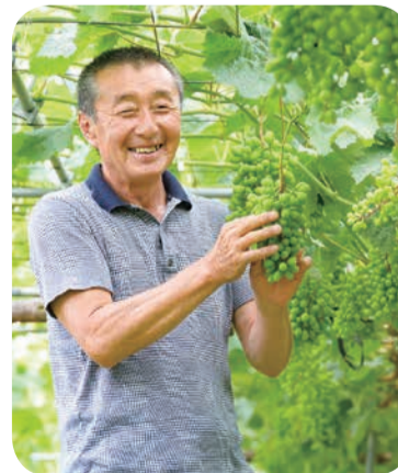
1粒が大きく玉張りするよう、一房一房粒を間引く作業に手間がかかる

「今はシャインマスカットのおかげで経営できているけれど、そろそろ次の一手が必要」と、この地で「久しく安泰」を願い、画期的な一手を模索中である。