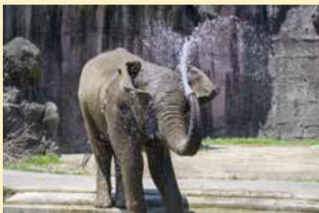
水遊びをするアフリカンゾウ

他にも「オーストラリア園」ではコアラやカンガルーなどの有袋類、「昆虫園」では年間を通して蝶が飛び交う姿や珍しい昆虫を見ることが出来る。園内を巡りながら、新しい発見を楽しんでほしい。