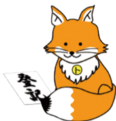
不動産登記推進イメージキャラクター「トウキョウネ」

正当な理由なく申請をしない場合には10万円以下の過料が科される可能性があります。制度等詳細は東京法務局 ☎03-5213-1330や司法書士会、法務省ホームページか同省民事第二課 ☎03-3580-4111(代表)へお問い合わせください。