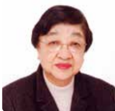
石井 ふく子さん(96歳) テレビプロデューサー

石井さんは、テレビプロデューサーとして数々のホームドラマを世に送り出すとともに、舞台演出家としても多くの作品を手掛けました。「心を伝える」ことを大切に、長きにわたり第一線で活躍を続け、人々に希望や活力を与えています。