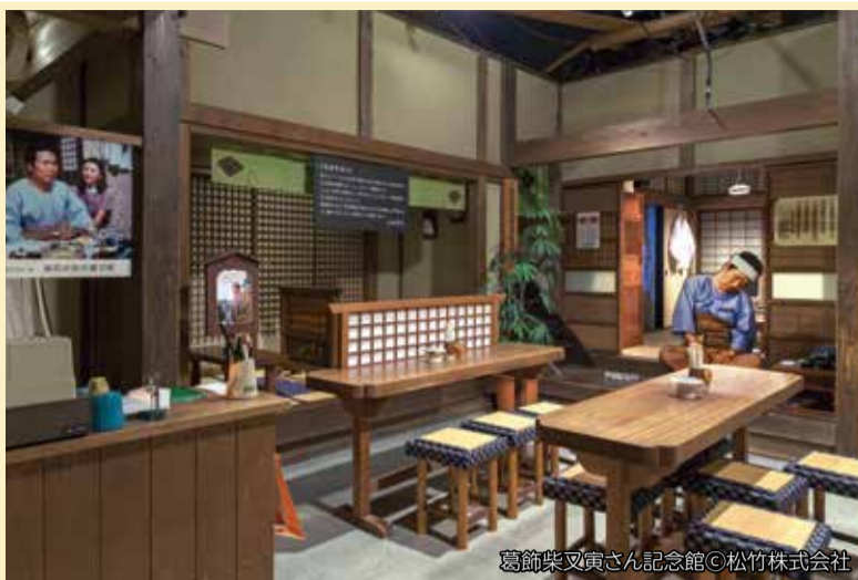
葛飾柴又寅さん記念館©松竹株式会社