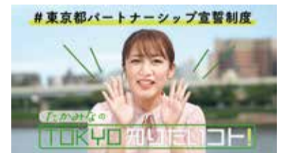
図 政策企画局広報広聴課 ☎03-5388-3090 HP