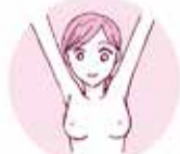
両腕を高く上げる