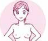
両腕を腰にあてる