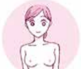
両腕をまっすぐに下ろす