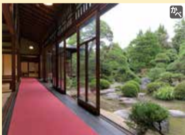
葛飾区登録有形文化財の一つ、山本亭

10月29日(日)・30日(月)は、寅さんサミットが開催される。寅さんが劇中で旅した中の25の地域が参加し、各地が大切にしている原風景や文化芸能、特産品等が柴又で楽しめる。さらに、帝釈天参道では期間限定メニューの販売や福引イベントも開催される。