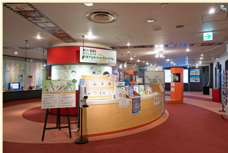
受付の後ろの柱には作家直筆サインが