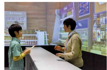
日常英会話にチャレンジする「アトラクションシーン」

いつでも、どこでも、誰でも使える英語教育・国際教育ポータルサイト「Tokyo GLOBAL Student Navi」を公開。英語学習や都の取り組みに関する情報収集にご活用ください。