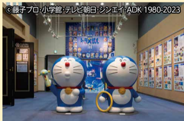
4月2日まで企画展「映画ドラえもん展」開催中

アニメ制作会社が多数集まり、数多くの上質な作品を生み出す杉並区。商店街にアニメのフラッグやモニュメント等もあるので、好きなキャラクターを探しながらの散歩も一興ではないだろうか。