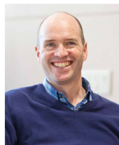
ベン・ホロウィッツさん