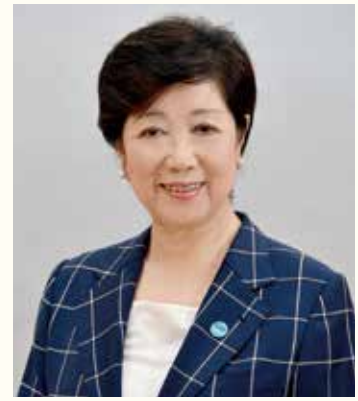
東京都知事 小池百合子

予算案を梃子として、都民の皆様との理解と共感を頂きながら、東京大改革の手を緩めることなく、「未来の東京」への歩みを力強く進めていきたいと考えております。