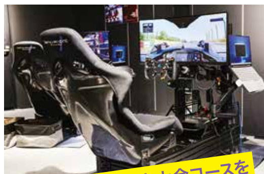
フォーミュラE東京大会コースをシミュレーション走行体験