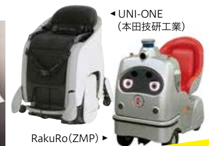
環境にやさしいさまざまな最新パーソナルモビリティの試乗体験