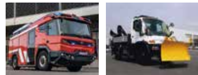
EVポンプ車 全災害対応型工作車

降灰下における車両の運行障害やエンジントラブルに対応し、救助活動を継続するとともに、早期復旧に向けた除灰等を実施する車両を追加配備